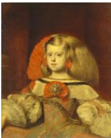
Веласкес "Портрет інфанти Маргарити" (1658 р.)

Перлиною колекції Б. І. Ханенка стала робота іспанського художника Дієго Веласкеса – "Портрет інфанти Маргарити" 1658 р.