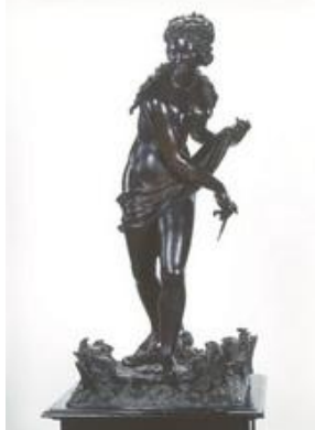
Ніколо Кордьє "Галатея" (1612 р.)

Робота належить провідному майстру римської скульптури межі XVI–XVII ст. Ніколо Кордьє.