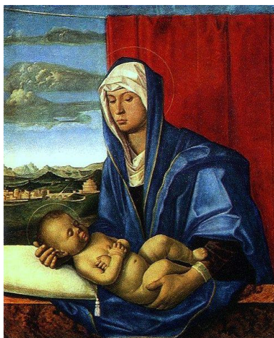
Дж. Белліні "Мадонна з немовлям" (прибл. 1450 р.)

У 1891 р. на аукціоні колекціонера М. А. Альберічі Б. Ханенко придбав роботи Якобелло дель Фйоре, Маестро ді Паоло та ін. У своїй колекції картин Б. І. Ханенко завжди виділяв "Мадонну з немовлям" майстра італійського Відродження Джованні Белліні. Стриманий, сповнений внутрішньої сили образ був створений художником зовсім інакше, ніж усі попередні мадонни.