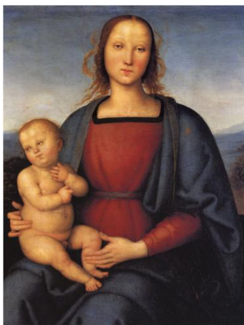
П'єтро Перуджіно "Мадонна з немовлям" (1500 р.)