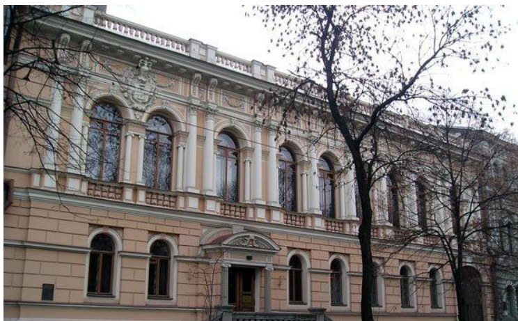
Національний музей мистецтв імені Богдана та Варвари Ханенків (вул. Терещенківська,15)

Переїхавши до Києва, Богдан Іванович і Варвара Миколаївна проживали в будинку М.Терещенка – батька Варвари. Цей будинок батько побудував для своєї доньки, попередньо придбавши ділянку землі по вулиці Олексіївській, 15.